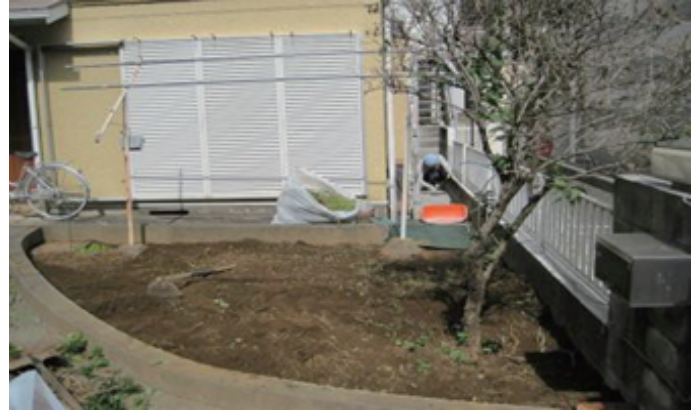
最初に除草をします。